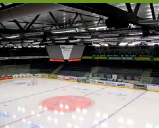
Gigantium - Aalborg

"Vi har haft et rigtig godt samarbejde med Spæncom. Allerede i projektets opstart kunne Spæncom bidrage med deres store erfaring og kendskab til opbygning af stadions, bl.a. hvad angår rytmisk last og høj sikkerhedsklasse. Derfor kunne vi præsentere et ishockey stadion, der for det første giver en rigtig god løsning på den nye hals sambygning med Gigantium, og for det andet har en ideel tribuneløsning med tribuner og overlappende hængetribuner, så alle tilskuere kommer tæt på banen og der opnås en fortættet og intens kampstemning."