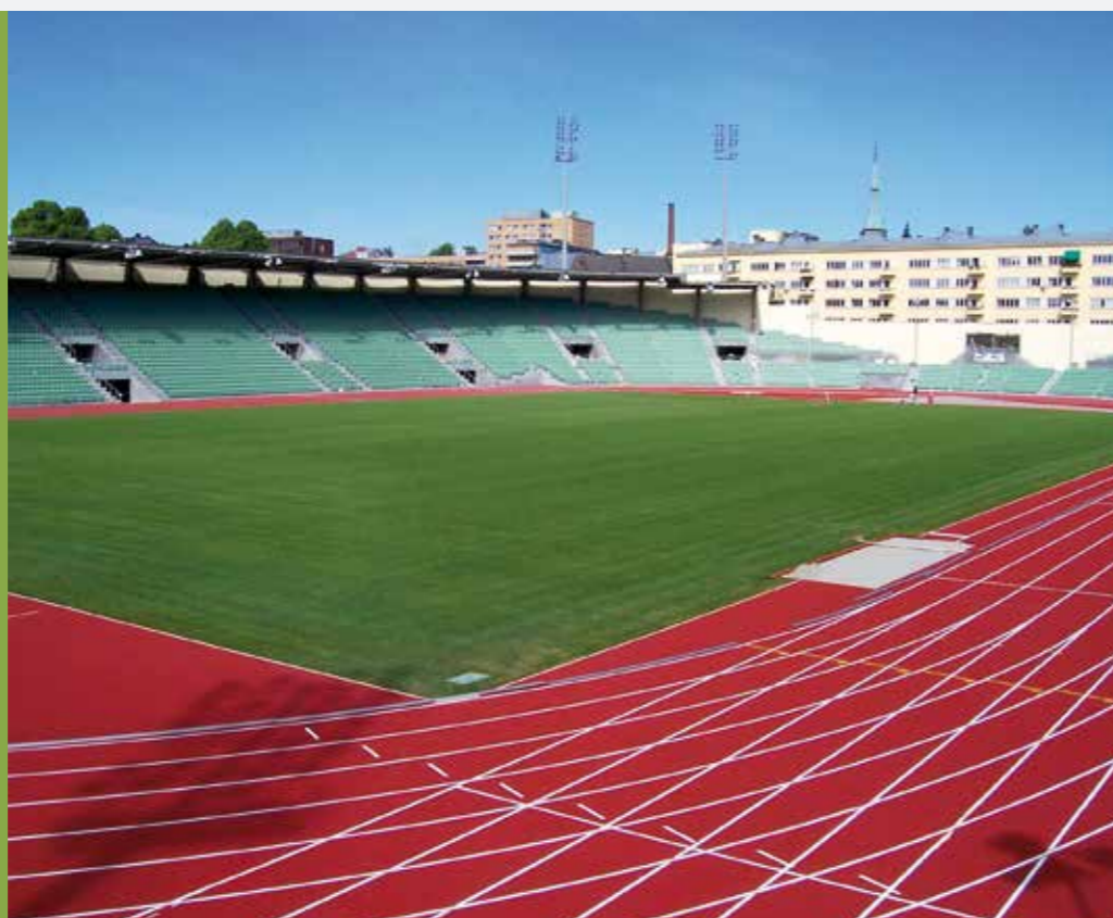
Nye Bislett Stadion - Oslo